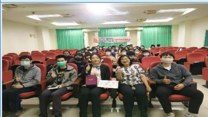
主任及參與學生與芝陽子副教授合影留念