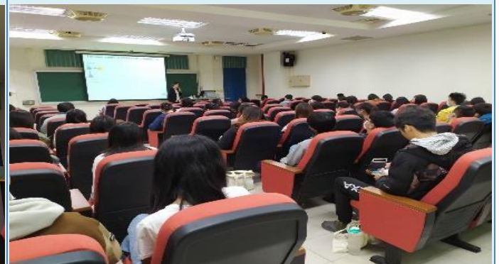
參與學生認真聽講