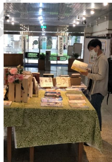
左：民雄分館 1F 中廊展場照片／右：讀者觀展