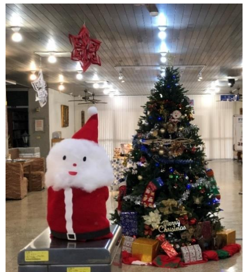
左：民雄分館 1F 中廊展場照片 / 右：民雄分館 1F 聖誕節布置照片