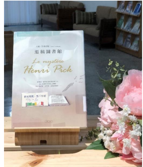
左：民雄分館 1F 中廊展場照片／右：民雄分館 1F 中廊展場照片