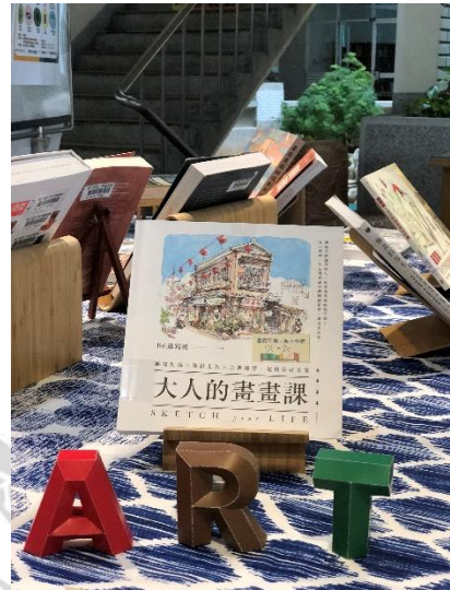
左：民雄分館 1F 中廊展場照片／右：民雄分館 1F 中廊展場照片