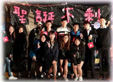
享用完美食後的交換禮物. 抽獎活動及 遊戲第一名組別的頒獎