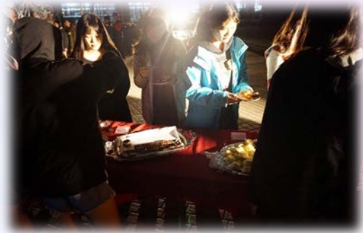
玩完遊戲後享用美味的 buffet