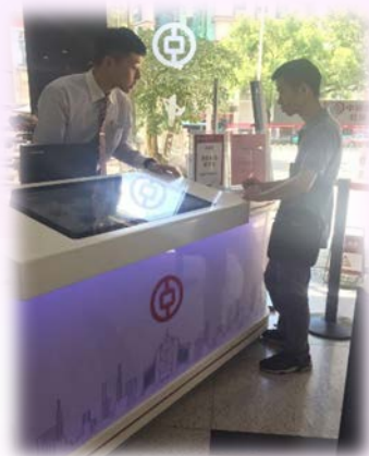
↑ 大堂引導員協客戶分流

深圳大小恰巧為新北市的大小，然而人口卻有2500萬人，故深圳的人口密度相當地高，就算有許多支行來服務客戶，其每間客流量仍相當大。此時，智能櫃台就扮演了相當重要的角色，在智能櫃檯上能夠轉帳、購買理財商品、保險、打印流水、開通手機銀行、開卡及更換動態安全憑證(E-token)等等，所以為櫃台業務疏通了一定的人潮，操作智能櫃台僅需幾位人員輔導操作與介紹項目的差異，即可辦理許多台灣必須臨櫃才能辦理的業務，為中國銀行節省了不少人力成本。在大堂實習的期間也充分體驗到金融服務業的辛苦，對於每位辦理業務的客戶都必須謙遜有禮且很有耐心地解釋客戶所提出的問題。所幸大堂經理總是在大堂穿梭處理大小事，並提供顧客專業的諮詢服務，也讓在一旁我邊觀摩邊實作，快速地熟悉上手許多業務。在台灣的銀行，經理較不常與客戶做第一線的接觸，然而在中國銀行我看到作為服務業的可貴精神，對於每個層級的客戶都能享受到大堂經理的最用心、最專業的服務。