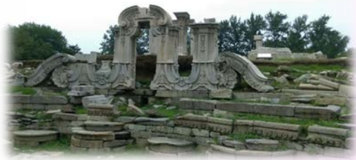
↑ 古蹟圓明園大法水

在北京期間中國銀行安排了參觀北京總行的行程，一踏入大廳便被浩大的氣場所震懾，華麗氣派的大廳有山明水秀，由國際建築大師貝聿銘所設計乃中西合璧的最佳示範，總行也時常接待各國政要，是個菁英雲集的人文薈萃的地方。隨後也參觀了保險庫與投資交易室，其中投資交易室最令我驚訝，每個交易員必須監控五至六台電腦，時時掌控基金、匯率與黃金貴重金屬、期貨選擇權的價格浮動。再加上一帶一路，中國銀行提供沿線國家的匯率報價，投入的新放貸總量達594 兆美元，為推動巨型政策的重要工程。交易室一天的交易額乃天文數字，儘管價格僅微幅波動 0.01 個百分點，其影響的資產金額仍達上億，令人大開眼見。隨後也參訪了相當著名的圓明園與頤和園，在殘破的大水法面前不禁感慨：戰爭無情且可怕，曾經的花好月圓，如今去成了殘破不堪的磚瓦散落在眼前，像是最強烈地無聲抗議戰爭的無情與百姓付出的慘痛代價。深刻地告誡我們和平與自我圖強的重要。