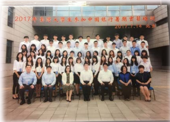
↑ 北京國際金融研訓院- 2017年大學生參加中國銀行暑期實習培訓

的經濟體的發展與變革牽一髮而動全身。同時作為全球經濟成長的引擎，又同時觀察周圍國家的發展經驗作為借鏡，彼此互相交流觀望，使中國的產業供需結構逐漸改變，進而影響全球金融市場走向。聽完劉玲玲教授的課程後，有了兩岸有著相同的經濟理論卻有不同的思想論點的體悟，進而使自己反思，培養出獨立思考的批判能力。